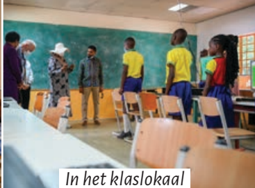
In het klaslokaal