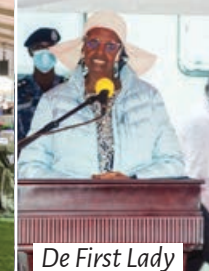
De First Lady