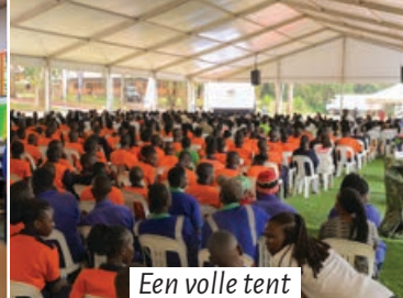
Een volle tent